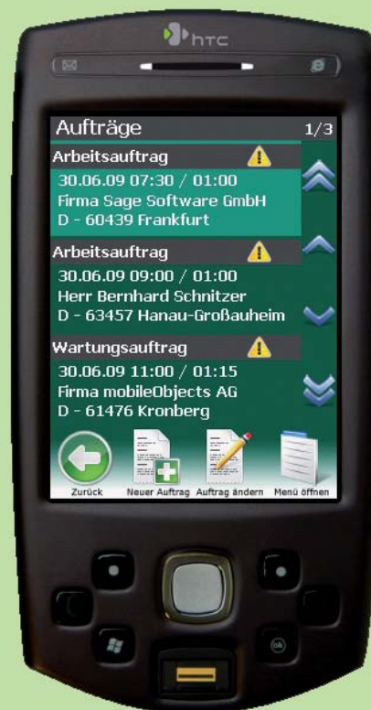
Endgerät für mobilen Kundenservice HTC P6500

Das Zusatzmodul mO – mobiler Kundenservice ermöglicht Ihnen und Ihren Mitarbeitern mit Hilfe spezieller Handys auch unterwegs auf Stammdaten und Aufträge im HWP zuzugreifen. Die Mitarbeiter können optimal gesteuert werden und sich per Navigationssoftware zum Kunden leiten lassen. Arbeiten lassen sich vor Ort dokumentieren, vom Kunden abzeichnen und per Knopfdruck an die Zentrale weiter leiten zwecks Rechnungsstellung.