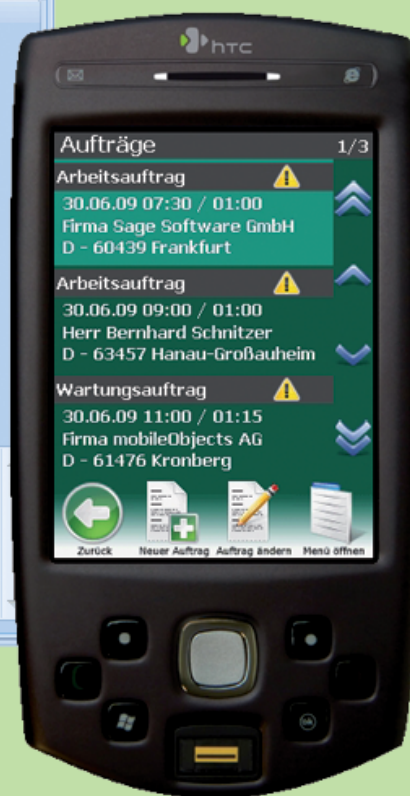
Endgerät für mobilen Kundenservice HTC P6500